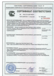
Сертификат соответствия на фитинги Stahlmann