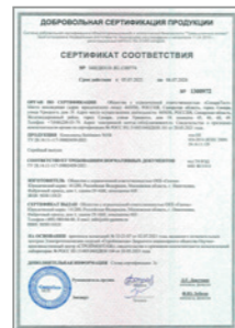
Сертификат соответствия на комплекты Stahlmann WHS