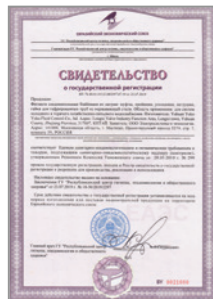
Свидетельство о государственной регистрации о соответствии продукции Единым санитарно-эпидемиологическим и гигиеническим нормам на фитинги соединительные Stahlmann