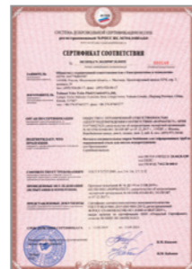
Сертификат соответствия Национального Пожарного Союза на фитинги Stahlmann