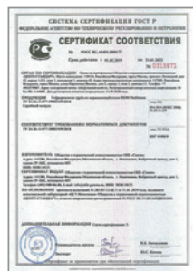
Сертификат соответствия на гофрированную трубу Stahlmann