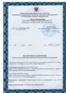
Санитарно-эпидемиологическое заключение на гофротрубу Stahlmann