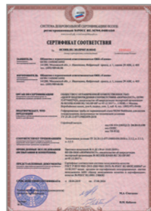
Сертификат соответствия Национального Пожарного Союза на гофротрубу Stahlmann